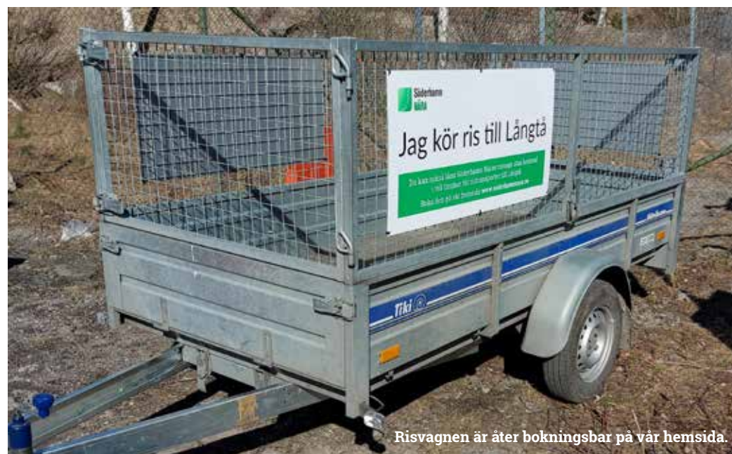
Risvagnen är åter bokningsbar på vår hemsida.

Släpvagnen får enbart användas till att transportera trädgårdsavfall och du får helt kostnadsfritt låna släpvagnen i två timmar per tillfälle.