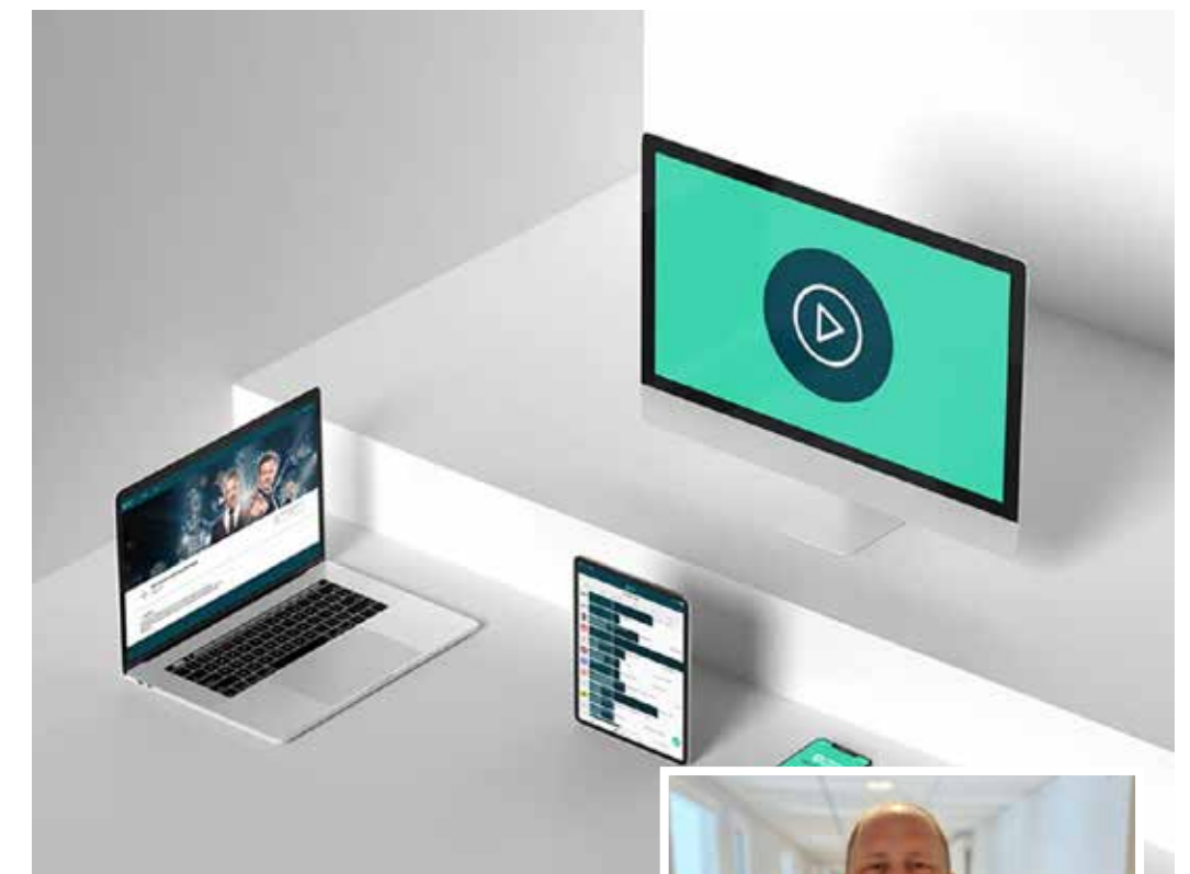
Med Sappa-appen behöver du inte missa några favoritprogram.

Vill du ha hjälp eller undrar något om Sappas tjänster, ring på 0774-444 744 och välj knappval 4. Genom att välja det knappvalet kommer du direkt till Sappas dotterbolag Svenska Cantab i Gävle som har många års erfarenhet av Söderhamns TV-tjänst.