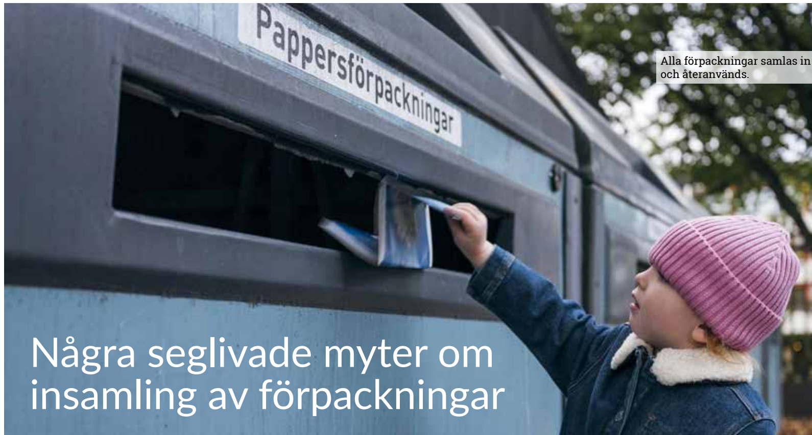
Alla förpackningar samlas in och återanvänds.