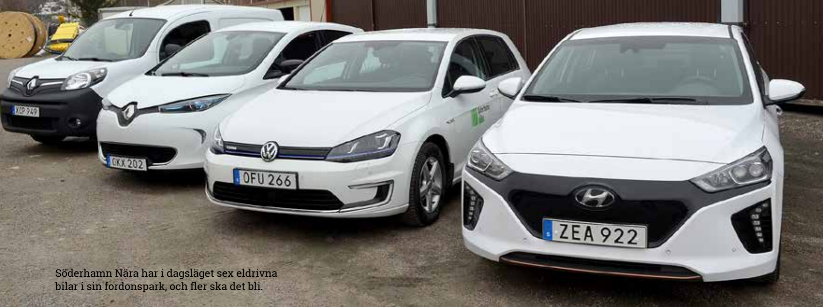
Söderhamn Nära har i dagsläget sex eldrivna bilar i sin fordonspark, och fler ska det bli.