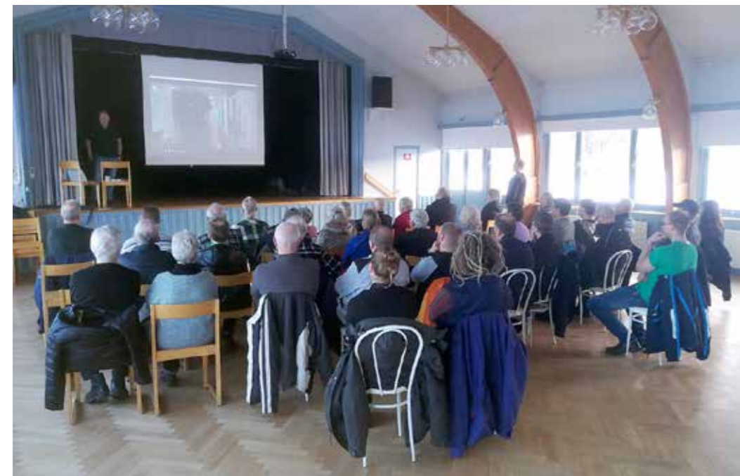
Ett 40-tal intresserade hade samlats på Altorps bygdegård i Norrala för att ta del av informationen på årets sista fiberträff.