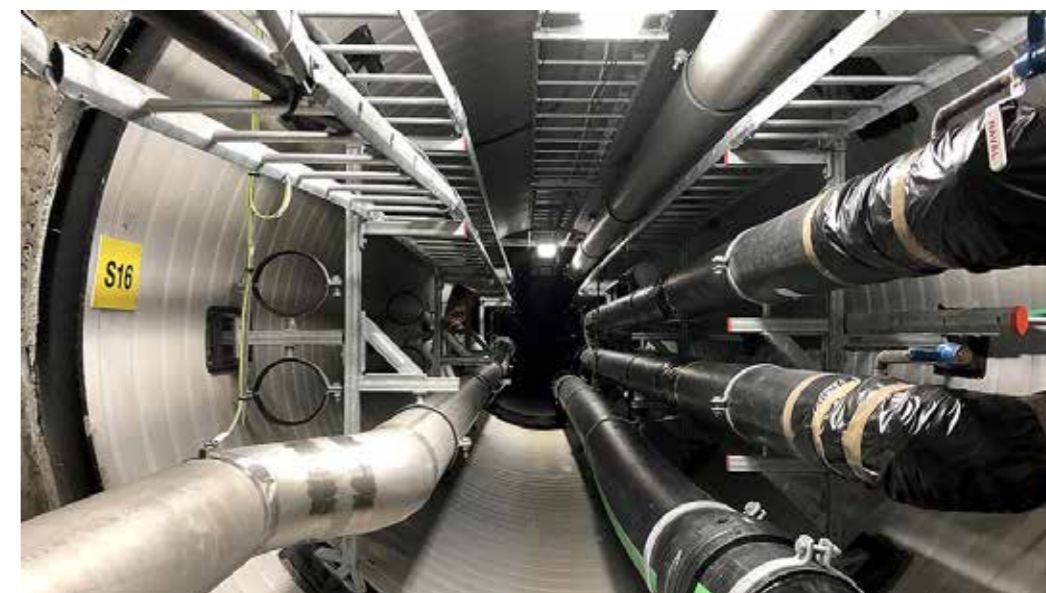
Genom att samförlägga all infrastruktur i stora vägtrummor har man kopplat samman allt i en 1 600 meter lång kulvert under marken.