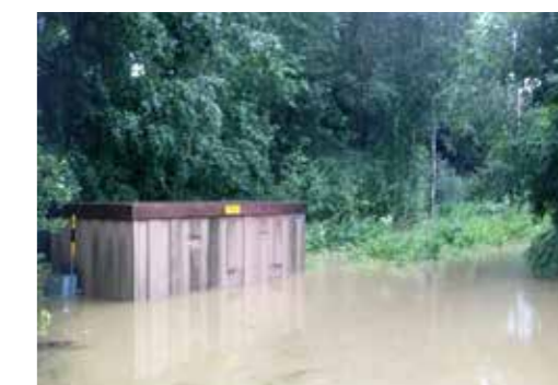
Nätstationen vid Tempo i Vågbro översvämmas i samband med den stora översvämningen i augusti 2013. Det är för att undvika liknande händelser i framtiden som Söderhamn Nära kommer att flytta stationen till högre terräng.

Nätstationerna, som i regel känns igen som små plåtbyggnader, finns på en rad platser inom Söderhamn Näras elnät. De är sammanlänkade med mottagningsstationerna via ett 10kV-nät och det är i dessa som elen transformeras ner till 0,4kV för att sedan