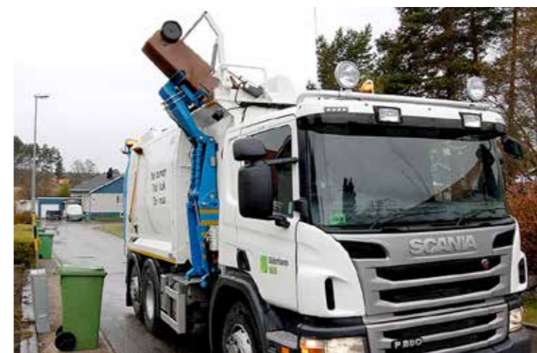
Underlätta gärna för våra chaufförer genom att ställa kärlet rätt.

Att köra sopbil kan vara besvärligt på vissa platser och extra besvärligt kan det vara på vintern. Den gångna vintern var särskilt svår med enorma snövallar och smala och svårframkomliga vägar. Ibland var det helt enkelt inte möjligt att ens ta sig fram till kärLEN.