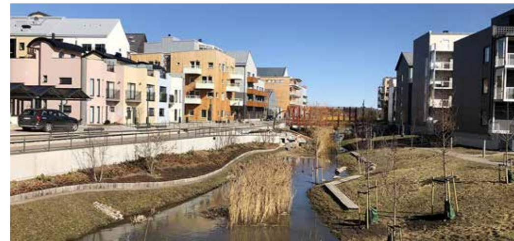
Arkitekturen är lekfull och full av mångfald. Så blir det när 40 byggherrar får fria händer att göra något bra.

Vallastaden har utvecklats i samverkan mellan kommunen, Linköpings universitet, Akademiska hus, områdesarkitekterna OkiDoki Arkitekter, näringsliv och ett stort antal engagerade Linköpingsbor. Projektet har gått från vision till inflyttning på fem år.