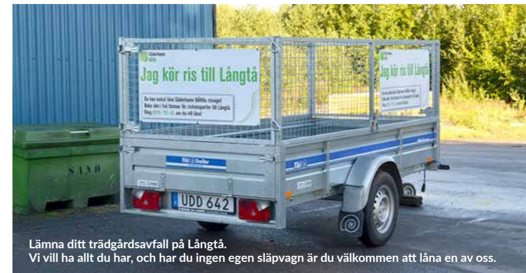
Lämna ditt trädgårdsavfall på Långtå. Vi vill ha allt du har, och har du ingen egen släpvagn är du välkommen att låna en av oss.

Har du ris och annat trädgårdsavfall som du vill frakta till Långtå, men inget lämpligt sätt att göra det på, är du välkommen att låna vår gallerförsedda släpvagn som är avsedd för just trädgårdsavfall*. Släpvagnen bokar du genom att kontakta Långtås reception. Antingen passar du på att boka den när du är på Långtå eller så ringer du receptionen på telefon 0270-751 43.