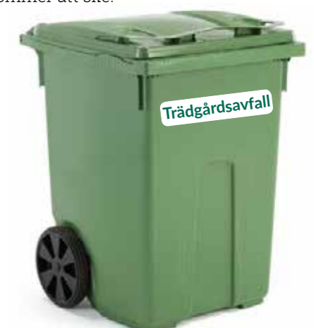
De fastighetsägare som väljer att delta i projektet får ett 370-literskärl för trädgårdsavfall.

Tjänsten kostar 200 kronor i månaden och trädgårdsavfallet hämtas sista onsdagen i varje månad mellan maj och oktober. Därefter plockas kärnen in och en utvärdering kommer att ske.