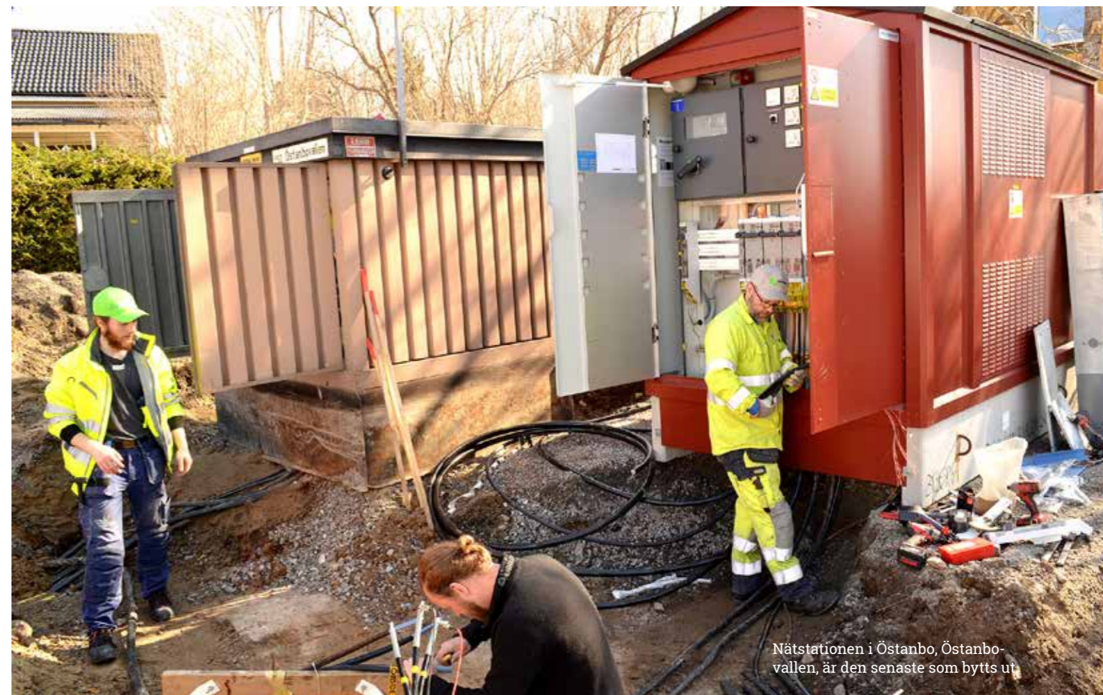
Nätstationen i Östanbo, Östanbovallen, är den senaste som bytts ut.